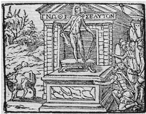
FIGUUR 2 'Gnothi Seauton', 'ken uzelf', oud-Grieks aforisme. Gravure uit Picta poesis (1552) van Barthélemy Aneau, een Frans dichter en humanist.